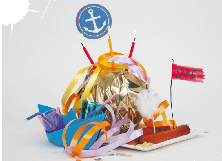
Dom (seit 1990), Hafengeburtstag (seit 1990)

VIELEN ST. PAULIANER_INNEN STÖBT DIE IMMER STÄRKERE EVENTISIERUNG IHRES STADTTEILS IN DEN VERGANGENEN JAHREN SAUER AUF UND NICHT SELTEN MACHEN SIE IHREM UNMUT DARÜBER AUCH LUFT. LEIDER MUSS MAN SICH ALS ANWOHNER_IN DANN IMMER WIEDER BELEHREN LASSEN. WER NACH ST. PAULI GEZOGEN SEI, WISSE WORAUF ER SICH EINGELASSEN HABE. STIMMT: AUF ST. PAULI GING ES SCHON IMMER WILDER ZU ALS IN ANDEREN STADTTEILEN. ABER TOURISTENBESPAßUNGEN WIE SCHLAGERMOVE, HARLEY DAYS UND CO. HAT ES BIS MITTE DER 1990ER NICHT GEGEBEN. WIE UNSERE VISUALISIERUNG ZEIGT, ST. PAULI MIT HILFE VON GROBEVENTS ZUR CASHCOW BZW. GOLDESEL DES HAMBURGER TOURISMUS ZU MACHEN, IST VOR ALLEM EINE ENTWICKLUNG DER VERGANGENEN JAHRE – GANZ IM EINKLANG MIT DEM STADTKONZEPT DES NEOLIBERALISMUS.