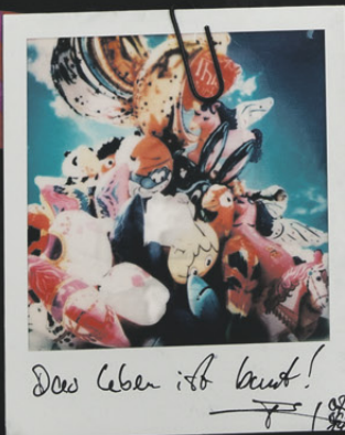
Das Leben ist kurz!

WESTAFRIKA -> VOKÜ immer montags (außer am 1. eines Monats) ab 20 Uhr in der Hafenstraße 116 -> anschließend Filmvorführung 🍌