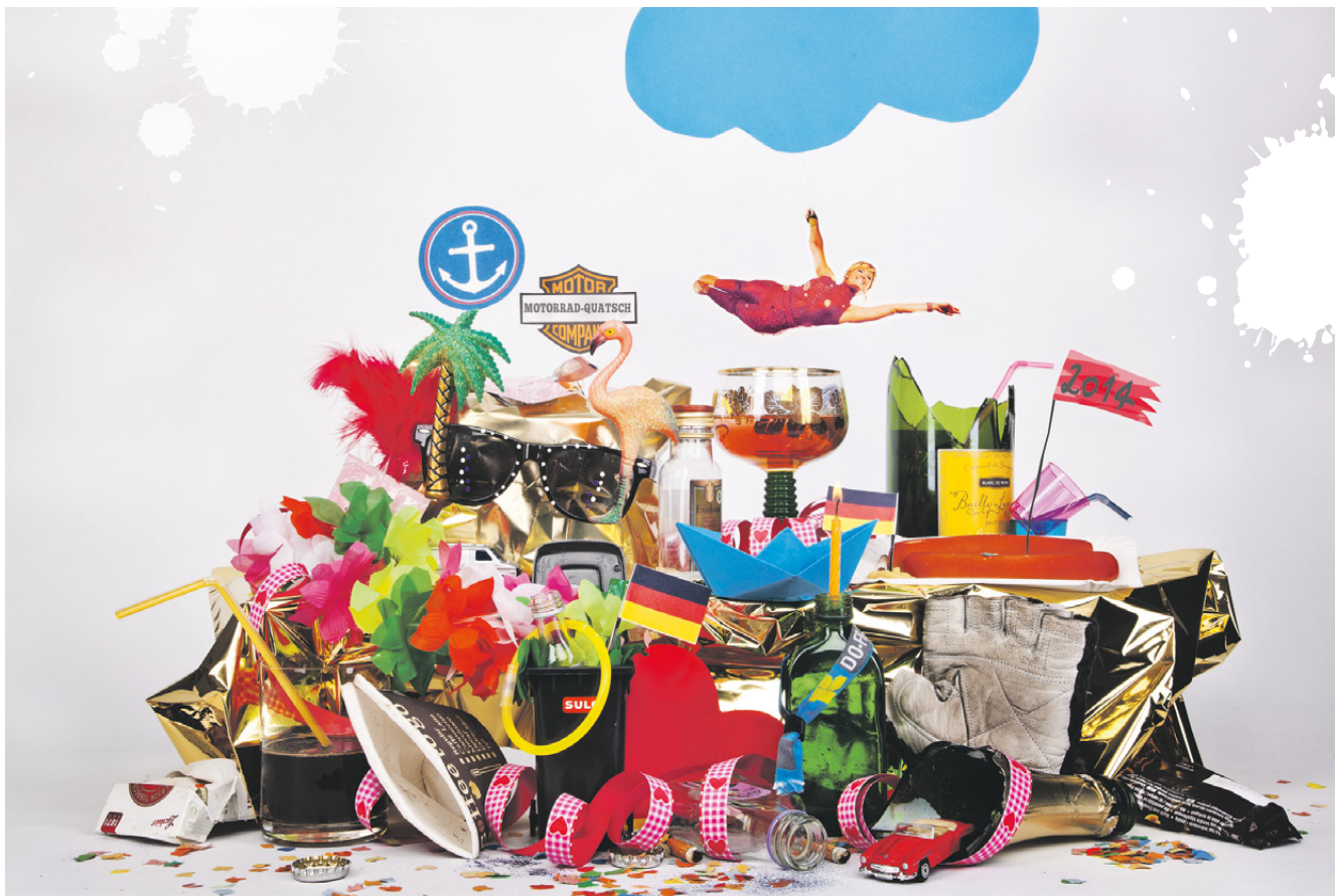
Dom, Hafengeburtstag, Cyclastics (seit 1996), Schlagermove (seit 1997), Eurovision Party (seit 2000), Public Viewing zur Fußball WM/EM (seit 2002), Harley Days (seit 2003), Reeperbahn Festival (seit 2006), Santa Pauli Weihnachtsmarkt (seit 2007), St. Pauli Nachtmarkt (seit 2007), Cruise Days (seit 2008), Grillfest am Spielbudenplatz (seit 2011), Winzerfest (seit 2011), diverse Promoaktionen (seit 2011)